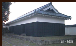
新築・改修再現修復に