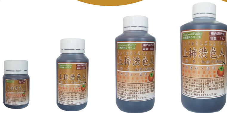
上柿渋色人(Fボトル)